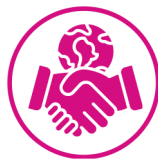
International and Regional Organizations