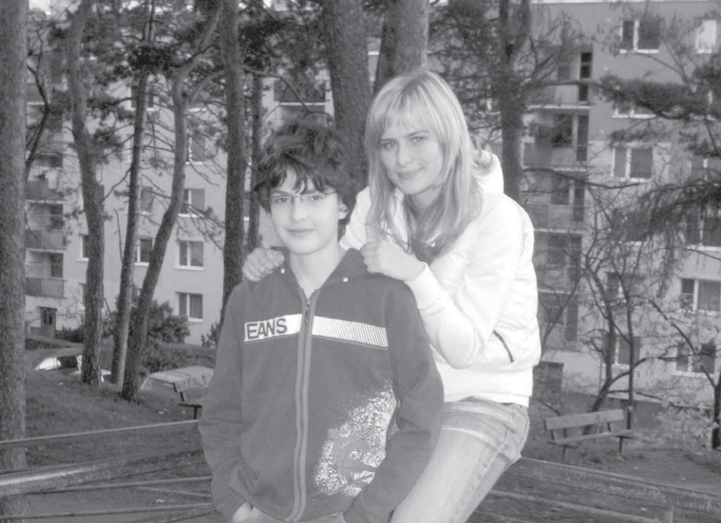
— naše dvojice v programu Pět P